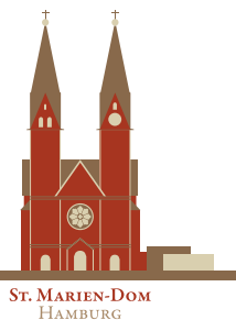
ST. MARIEN-DOM HAMBURG