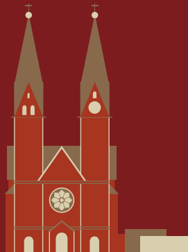
ST. MARIEN-DOM HAMBURG