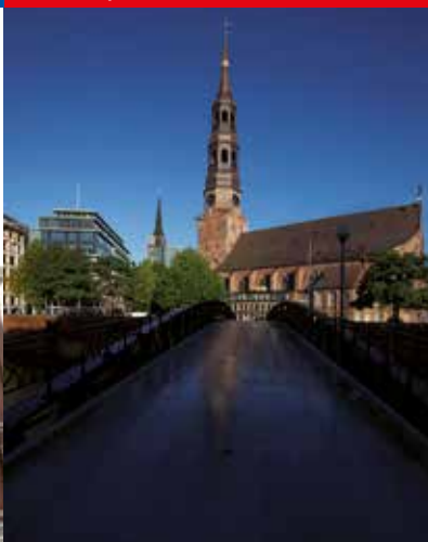
Hauptkirche St. Katharinen