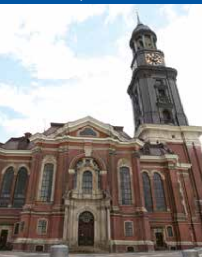
Hauptkirche St. Michaelis