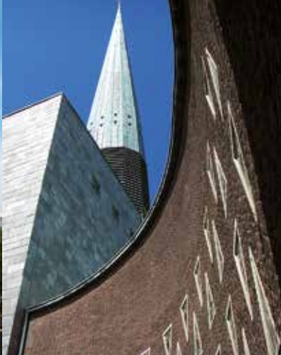
Hauptkirche St. Nikolai am Klosterstern