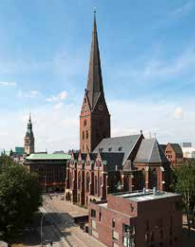
Hauptkirche St. Petri