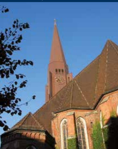
Hauptkirche St. Jacobi