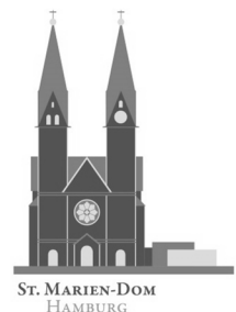
ST. MARIEN-DOM HAMBURG

Am Mariendom 7 20099 Hamburg www.mariendomhamburg.de